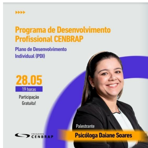
Figura 1: Divulgação da Palestra

Em suma, a palestra "Plano de Desenvolvimento Individual" foi um sucesso, cumprindo seu propósito de capacitar os estudantes e ex-alunos da Faculdade CENBRAP com ferramentas práticas para o seu crescimento pessoal e profissional (Figuras 1 a 4).