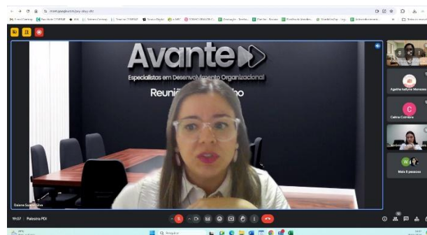
Figura 2: Palestra